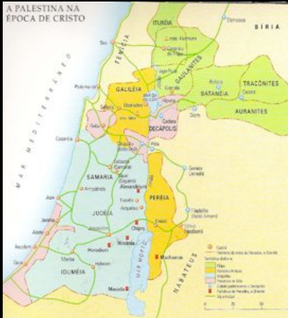
Mapa político da Palestina na época de Cristo