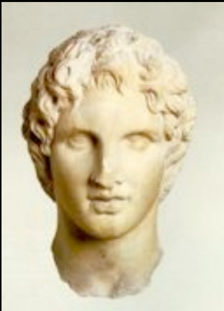
Busto de Alexandre

Em 331 a.C. o mundo conheceu o maior de seus generais. Seu nome era Alexandre, ele vinha da Grécia, e mudou para sempre o perfil do mundo antigo, principalmente pela disseminação da cultura e da língua dos gregos.