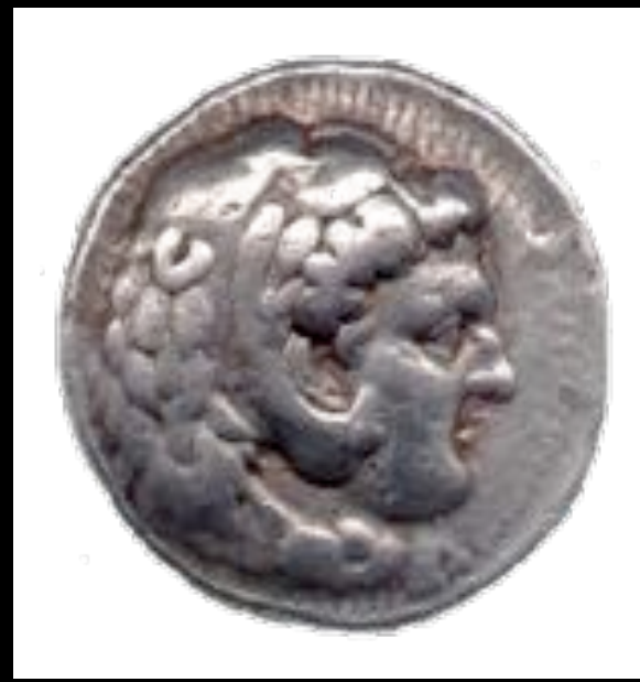
Moeda cunhada com a imagem de Alexandre